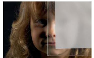
Mattiertes Glas mit klarem Rand (Sonderausstattung)