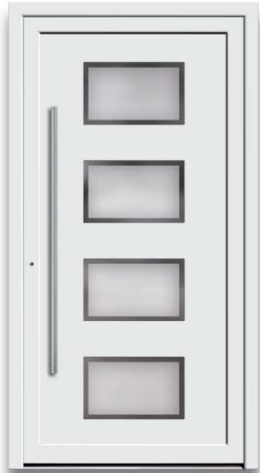
Modell HT50-50 | Glas: G 500-25 mattier- tes Glas mit klarem Rand | Mit 1200 mm Edelstahl-Stangengriff