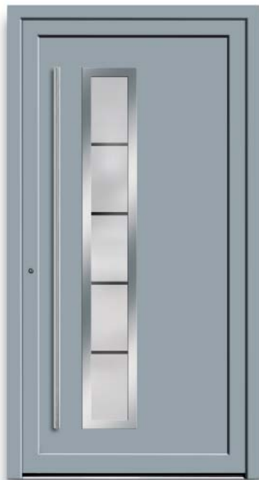
Modell HT41-70 | Rahmen-Edelstahloptik | Farbe: RAL 7001 silbergrau | Glas: G 1313 mattiertes Glas mit klaren Streifen | Mit 1600 mm Edelstahl-Stangengriff