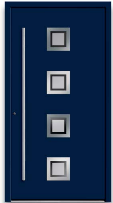
Modell HT43-70 | Rahmen-Edelstahloptik | Farbe: RAL 5011 stahlblau | Glas: G 500-25 mattiertes Glas mit klarem Rand | Aufsatz- füllung | Mit 1600 mm Edelstahl-Stangengriff