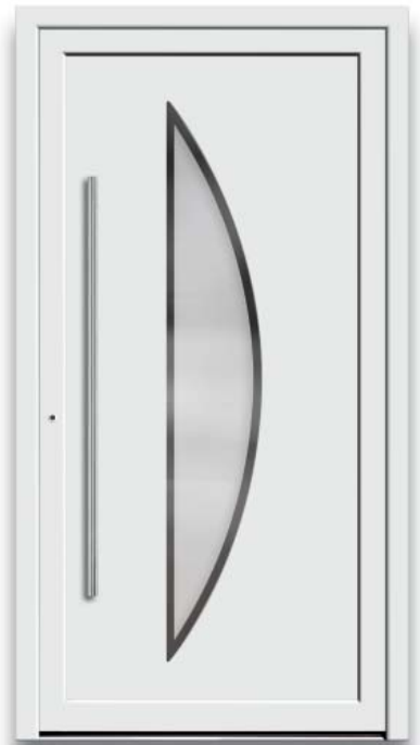
Modell HT47-50 | Glas: G 500-25 mattiertes Glas mit klarem Rand | Mit 1200 mm Edelstahl-Stangengriff