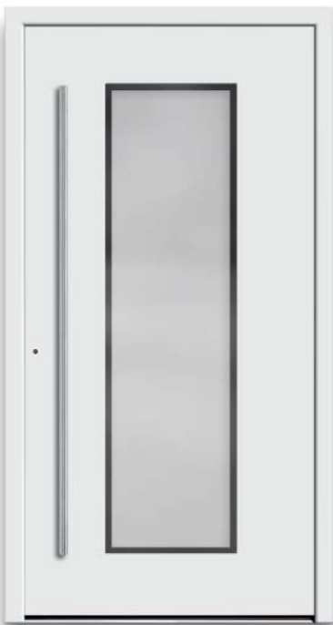
Modell HT52-50 | Glas: G 500-25 mattiertes Glas mit klarem Rand | Aufsatzfüllung | Mit 1600 mm Edelstahl-Stangengriff