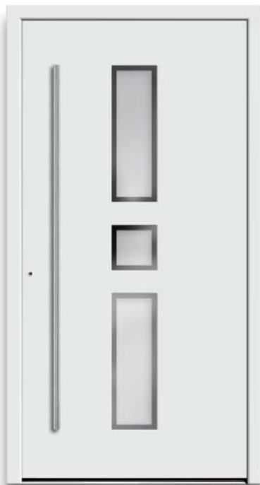
Modell HT51-50 | Glas: G 500-25 mattiertes Glas mit klarem Rand | Aufsatzfüllung | Mit 1600 mm Edelstahl-Stangengriff