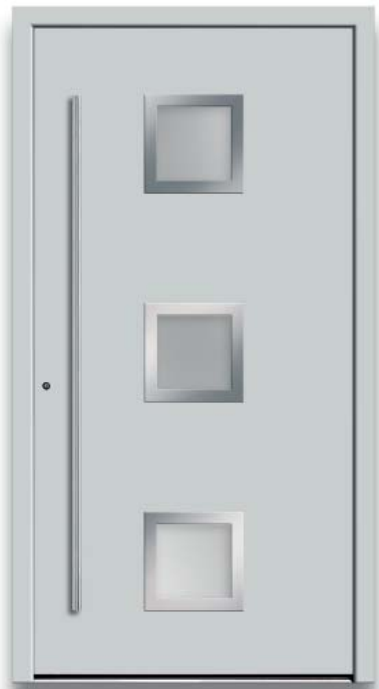
Modell HT46-70 | Rahmen-Edelstahloptik | Farbe: RAL 7035 lichtgrau | Glas: Satinato weiß | Aufsatzfüllung | Mit 1600 mm Edelstahl-Stangengriff