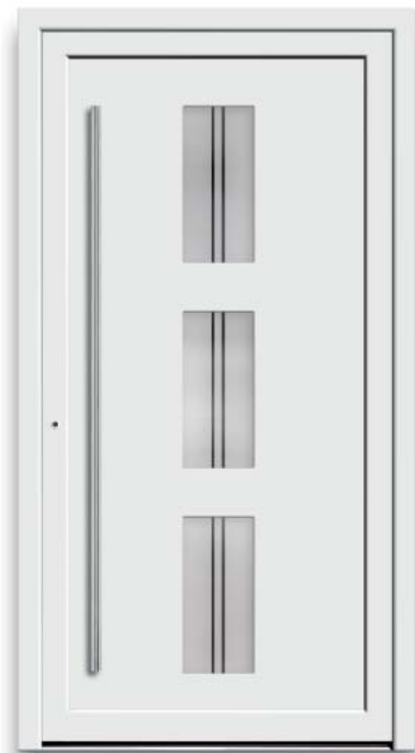
Modell HT45-50 | Glas: G 1311 mattiertes Glas mit klaren Streifen | Mit 1600 mm Edelstahl-Stangengriff