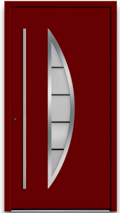
Modell HT47-70 | Rahmen-Edelstahloptik | Farbe: RAL 3004 purpurrot | Glas: G 1312 mattiertes Glas mit klaren Streifen | Aufsatzfüllung | Mit 1600 mm Edelstahl-Stangengriff