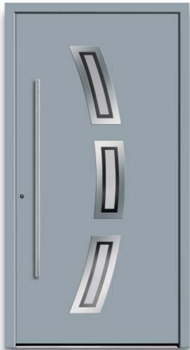
Modell HT48-70 | Rahmen-Edelstahloptik | Farbe: RAL 7001 silbergrau | Glas: G 500-25 mattiertes Glas mit klarem Rand | Aufsatzfüllung | Mit 1200 mm Edelstahl-Stangengriff