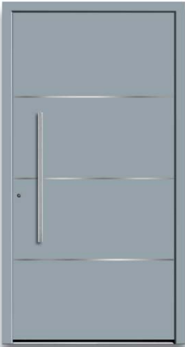
Modell HT30-94 | flächenbündige Lisenen | Farbe: RAL 7001 silbergrau | Aufsatzfüllung | Mit 800 mm Edelstahl-Stangengriff