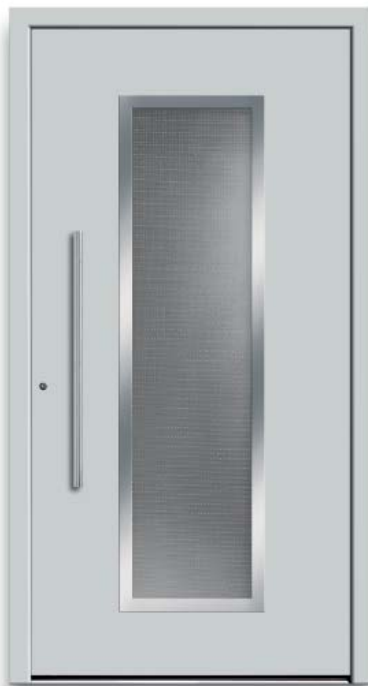
Modell HT52-70 | Rahmen-Edelstahloptik | Farbe: RAL 7035 lichtgrau | Glas: Mastercarré weiß | Aufsatzfüllung | Mit 800 mm Edelstahl- Stangengriff