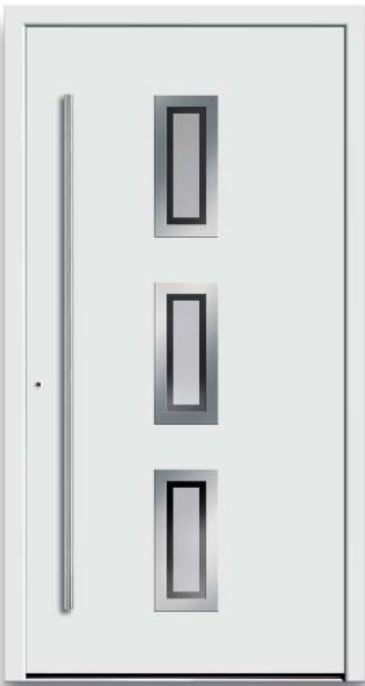
Modell HT45-70 | Rahmen-Edelstahloptik | Glas: G 500-25 mattiertes Glas mit klarem Rand | Aufsatzfüllung | Mit 1600 mm Edelstahl-Stangengriff