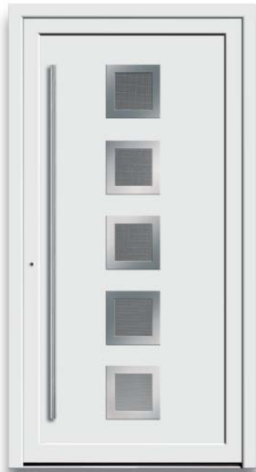
Modell HT44-70 | Rahmen-Edelstahloptik | Glas: Mastercarré weiß | Mit 1600 mm Edelstahl-Stangengriff