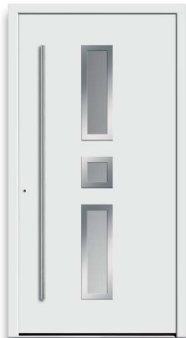
Modell HT51-70 | Rahmen-Edelstahloptik | Glas: Satinato weiß | Aufsatzfüllung | Mit 1600 mm Edelstahl-Stangengriff