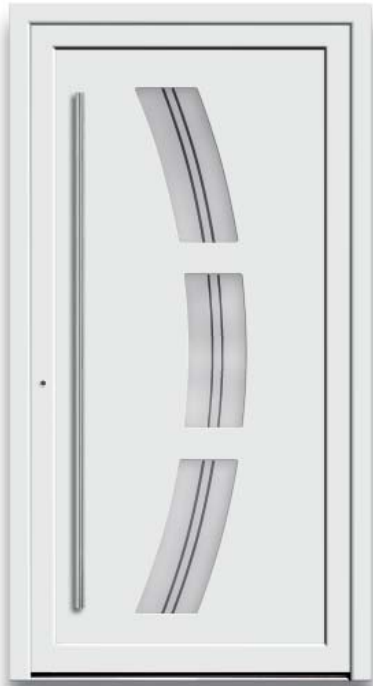
Modell HT48-50 | Glas: G 1310 mattiertes Glas mit klaren Streifen | Mit 1600 mm Edelstahl-Stangengriff