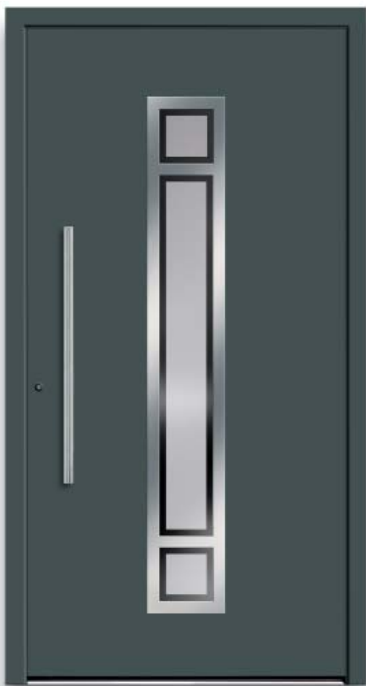
Modell HT42-70 | Rahmen-Edelstahloptik | Farbe: RAL 7012 basaltgrau | Glas: G 505-25 mattiertes Glas mit klarem Rand | Aufsatz- füllung | Mit 800 mm Edelstahl-Stangengriff