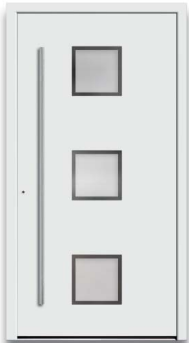
Modell HT46-50 | Glas: G 500-25 mattiertes Glas mit klarem Rand | Aufsatzfüllung | Mit 1600 mm Edelstahl-Stangengriff