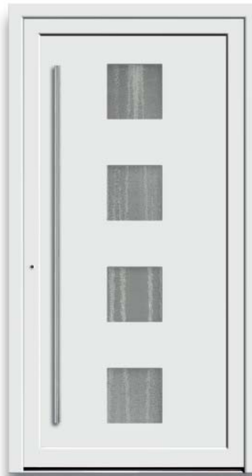
Modell HT43-50 | Glas: Chinchilla weiß | Mit 1600 mm Edelstahl-Stangengriff