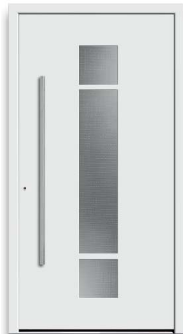
Modell HT42-50 | Glas: Mastercarré weiß | Aufsatzfüllung | Mit 1200 mm Edelstahl- Stangengriff

| Abbildung unten | Modell HT40-70 | Rahmen-Edelstahloptik | Ganzglas-Seitenteilen | Glas: Satinato weiß | Aufsatzfüllung | Mit 800 mm Edelstahl-Stangengriff