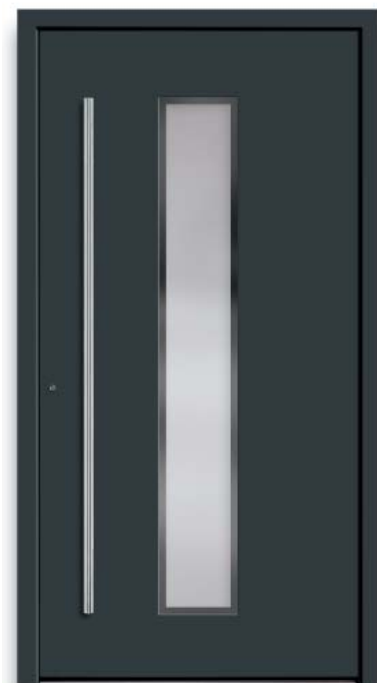
Modell HT40-50 | Farbe: RAL 7016 anthrazitgrau | Glas: G 500-25 mattiertes Glas mit klarem Rand | Aufsatzfüllung | Mit 1600 mm Edelstahl-Stangengriff