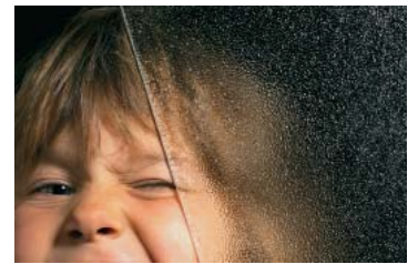
Ornament 504 weiß