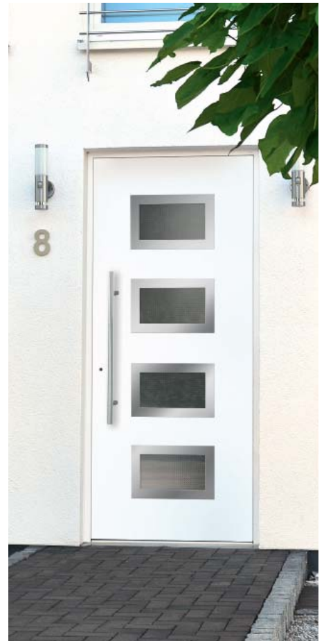
| Abbildung oben | Modell HT50-70 | Rahmen-Edelstahloptik | Glas: Mastercarré weiß | Aufsatzfüllung | Mit 800 mm Edelstahl-Stangengriff