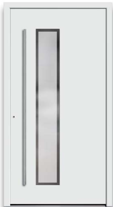
Modell HT41-50 | Glas: G 500-25 mattiertes Glas mit klarem Rand | Aufsatzfüllung | Mit 1600 mm Edelstahl-Stangengriff