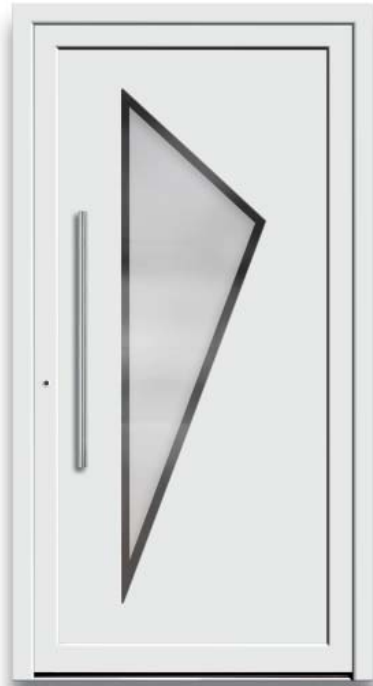
Modell HT49-50 | Glas: G 500-25 mattiertes Glas mit klarem Rand | Mit 800 mm Edelstahl-Stangengriff