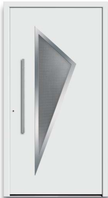
Modell HT49-70 | Rahmen-Edelstahloptik | Glas: Mastercarré weiß | Aufsatzfüllung | Mit 800 mm Edelstahl-Stangengriff