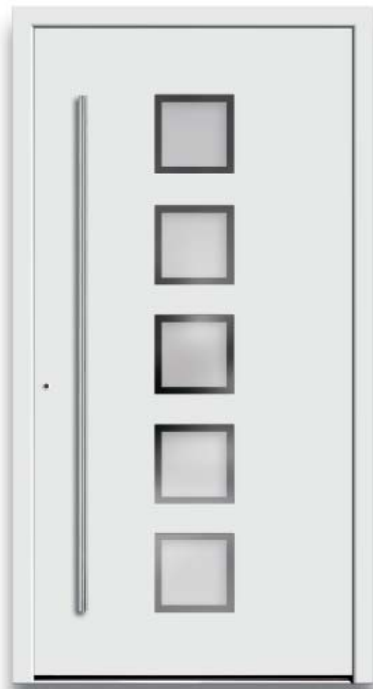
Modell HT44-50 | Glas: G 500-25 mattiertes Glas mit klarem Rand | Aufsatzfüllung | Mit 1600 mm Edelstahl-Stangengriff